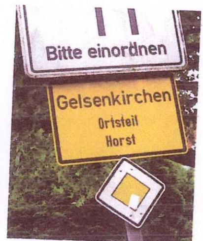
Eine Reise ins BVB-Musikarchiv: Gregor unterwegs nach Gelsenkirchen, um den Sänger von „Heja BVB“ zu finden.